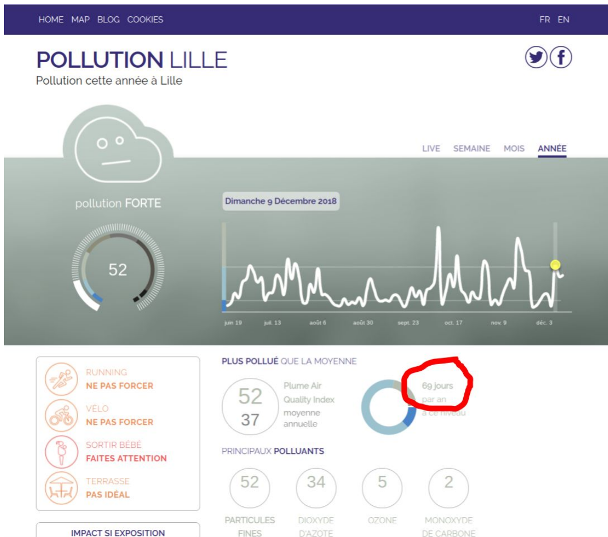
69 jours avec pollution forte

Lille s'est portée candidate pour être la capitale verte de l'Europe en 2021, mais tout nous prouve le contraire. 2 Avec plus de 60 jours de pollution forte en 2018 3 et un public en demande de plus d'efforts pour le climat, 4 la ville de Lille pourrait y donner une place majeure dans le cadre du PLU2 et agir activement à la diminution de la pollution par la réduction des déplacements motorisés et la promotion de nouveaux comportements de mobilité. Sans cela, nous demeurons une des capitales de la pollution en Europe.